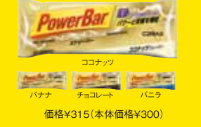
ココナッツ バナナ チョコレート ハニラ 価格¥315(本体価格¥300)

パワーバー エナジーバー PowerBar 体を動かすために、パワーと栄養を補給!