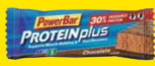
チョコレート 価格¥399(本体価格¥380)

パワーバー プロテインプラス Protein Plus 動いた後の、カラダづくり!