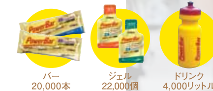
バー 20,000本 ジェル 22,000個 ドリンク 4,000リットル

今年もPowerBarはツール・ド・フランスのオフィシャルスポンサーとして、20日にわたるレース期間中の選手のエネルギーチャージを全面サポート。