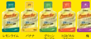
レモンライム バナナ グリーンアップル トロピカルフルーツ 梅 価格¥263(本体価格¥250)

パワーバー パワージェル PowerGel 動き続けるために、すばやくパワーを補給!