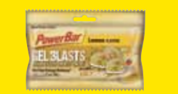
チョコレート 価格¥357(本体価格¥340)