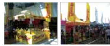
アイアンマンジャパン70.3

2011年は宮古島トライアスロンを皮切りに、ロードレース、MTBレース、トライアスロンにブース出店してきました。PowerBarはユーザーの声が直接聞けるブース出店を大切にしています。これからも可能な限り、様々なレース会場に出店いたします。今度もサイクリスト、トライアスロンのみなさんとお会いすることを楽しみにしています。