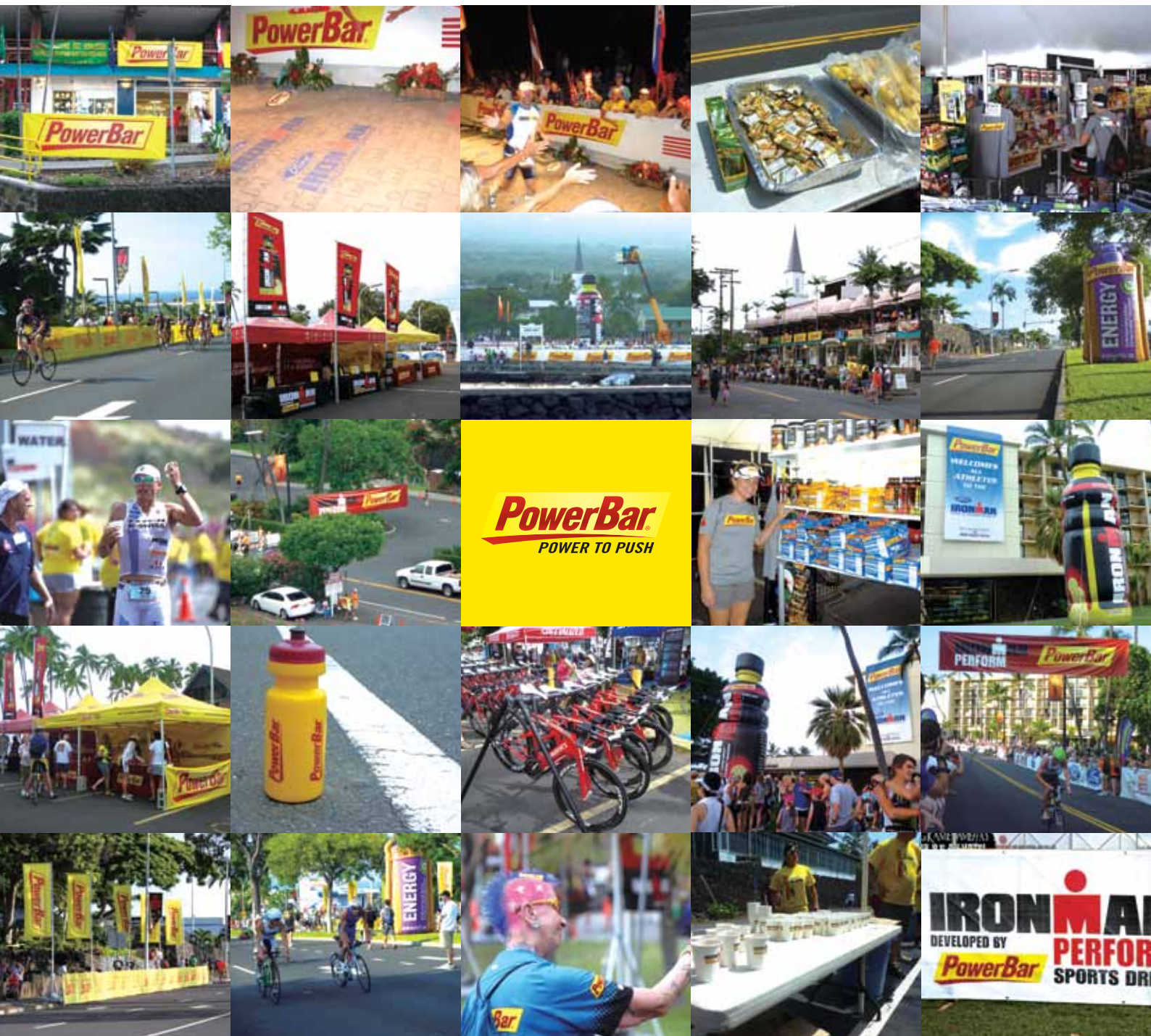
Date 2011年10月8日(土)

50カ国以上、約2000人のアスリートのパワーの源となったPowerBar。スポーツエリートが行く手を、大勢の観客と共に大いに賑わした。