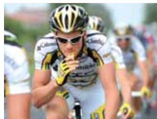
PowerBarはhtcチームをサポートしている。

ブランドPowerBarは、この壮かつ歴史あるレースを、エナジーバー、スポーツドリンク、ジェルのオフィシャルスポンサーとして、全20ステージで選手たちの栄養補給を全面的にサポート。