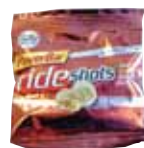
日本国内新製品ジェルプラスト。ヨーロッパでは「rideshots」として親しまれている。

レースの規模が規模ならそのサポート体制も度肝を抜く。そしてこの4月、日本国内のサイクルショップ先行発売となったジェルプラストは70,000袋!ジェルプラストは特に過酷な山岳ステージでサイクリストたちに手渡された。どのようなサポート体制で、どのようなプロモーションで2011年の