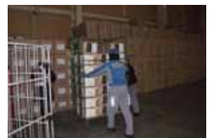
PowerBar Japanからの義援物資 PowerBarエナジーバー8000本、Tシャツ1500枚、飲料など

被災地の一日も早い復興を願うとともに、尽力していらっしゃる消防隊、自衛隊をはじめとする皆様、ボランティアの皆様には心より敬意を表します。PowerBar Japanは被災された皆様への救済、および現地で救助、復興のために力を尽くしていらっしゃる皆様に向けて、3月22日に代表取締役自ら3市3郡、計10箇所の避難所に義援物資を届けてまいりました。実際に現地を訪れると、メディアを通じて知る情報と現地で求められているもののギャップを感じることもありました。それを踏まえ、今月(4月)は前回お届けできなかった物資と共に現地に足を運ぶ予定です。