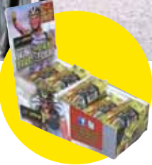
店舗に並ぶバーの箱にもPowerBarがサポートしているカヴァンディッシュの写真が!