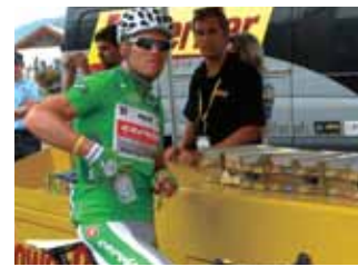
エイドステーションでは数あるエナジーバー、パワージェルの中から選び放題!

毎年7月に開催されるツールドフランス。2010年は97回目を迎えた。総走行距離3,596km、山岳ステージ10ステージという過酷な戦いに22チーム198名の選手が挑んだ。世界的なスポーツ栄養食品