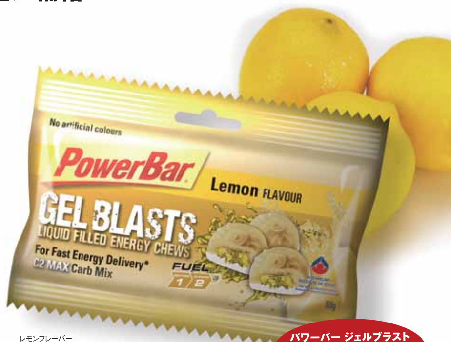
レモンフレーバー

新製品「パワーバージェルブラスト」はグミの中にパワージェルが詰まったエネルギー補給食品です。運動中に美味しく手軽にエネルギー補給をしていただくために開発され、世界のサイクリストが愛用しています。「パワーバージェルブラスト」には、筋肉に素早くエネルギーを運び込むため、ブドウ糖と果糖を2:1の割合で配合した炭水化物ブレンド「C2MAX」が効率よく含まれており、アスリートの最高のパフォーマンスを手助けします。「C2MAX」はエネルギーを長く貯蔵し、血糖低下の不快感を解消。そしてエネルギー吸収率、持続力を確実に高めます。その吸収率は水のみ吸収率に比べ17%、ブドウ糖単体よりも8%高く吸収されます。